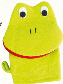
MOROCCAN OIL BATH GLOVE GREEN