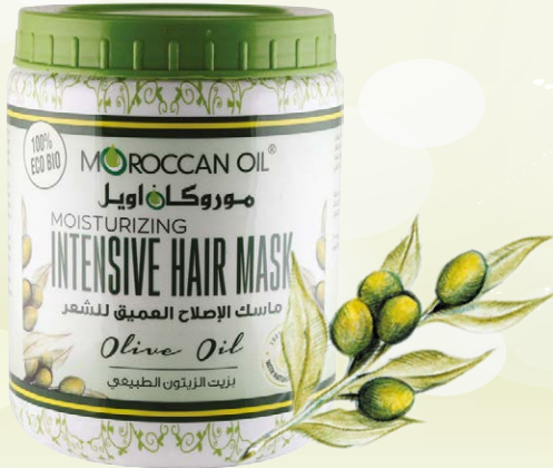
Moisturizing Intensive Hair Mask with Olive Oil NTC: 3777659 (1000ml)

This Mask is a unique cream combined with Olive Oil to create the ideal nurturing for hair that needs help. This botanically content rich mask is most needed to damage hair exposed to chemical processing or treated with extremely high heat styling.