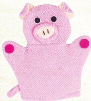
MOROCCAN OIL BATH GLOVE PINK