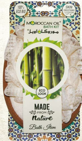
BATH PAD Item No. ST1318-N NTC: 3777679