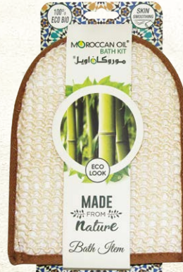
SISAL BATH GLOVE Item No. ST1621-1 NTC: 3777690