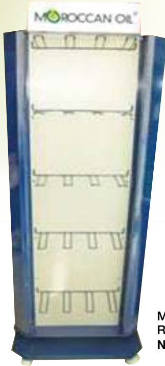
MOROCCAN OIL ROTATING DISPLAY STAND NTC: 377S003