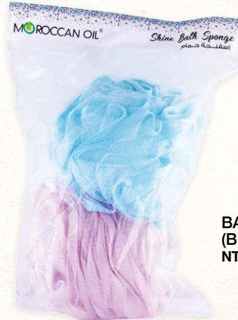
BATH SPONGE (BLUE & VIOLET) 2-IN-1 NTC: 3777693

Use this with your favorite Moroccan Soap, shower gel or body wash and gently lather upto cleanse your skin for a rejuvenated and smooth finish that looks and feels spectacular.