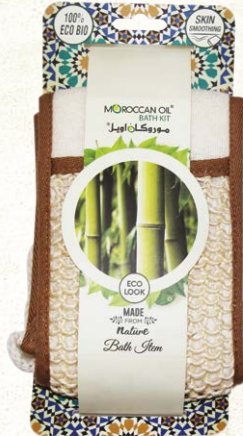
SISAL BACK STRAP Item No. ST1162-1 NTC: 3777689