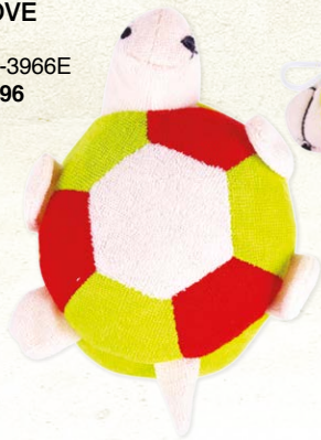
MOROCCAN OIL BATH SPONGE GREEN