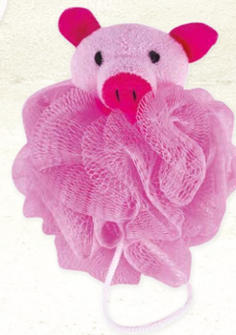
MOROCCAN OIL BATH SPONGE PINK