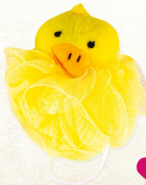
MOROCCAN OIL BATH SPONGE YELLOW