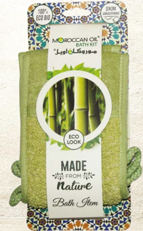
RAMIE BACK STRAP Item No. ST1162-5 NTC: 377685