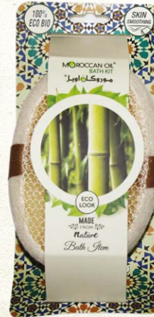
NYLON BATH SPONGE Item No. SS1015-N NTC: 377684