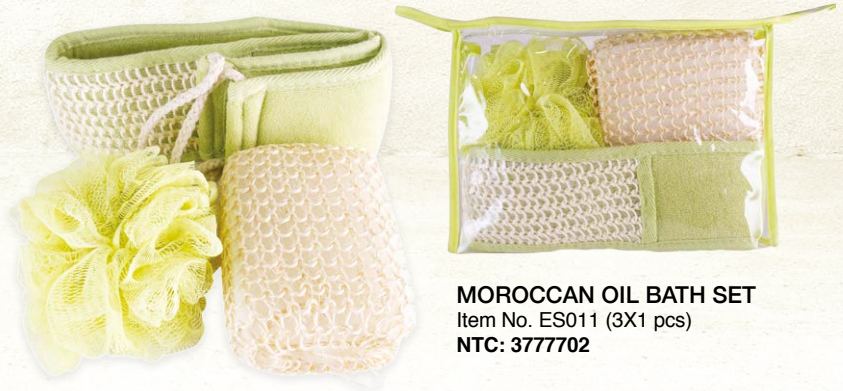
MOROCCAN OIL BATH SET Item No. ES011 (3X1 pcs) NTC: 3777702

Sisal back strap: made of natural Sisal, it will leave your skin smooth, soft and gently exfoliated.