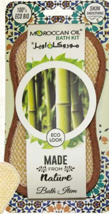
NYLON BATH SPONGE Item No. SS0818-N NTC: 377683