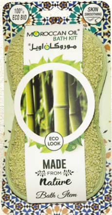
RAMIE BATH SPONGE Item No. ST0818-5 NTC: 3777687