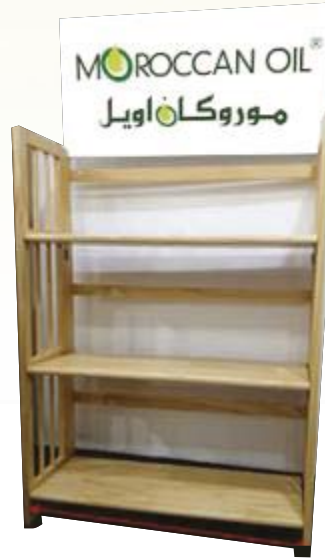
MOROCCAN OIL FOLDING DISPLAY STAND NTC: 377S004