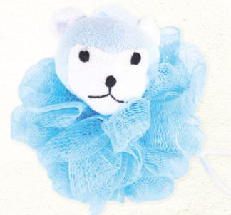
MOROCCAN OIL BATH SPONGE BLUE