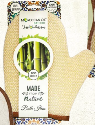
NYLON BATH GLOVE Item No. SS1822-N NTC: 377682