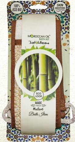
RAMIE BACK STRAP Item No. ST0835-1 NTC: 3777688