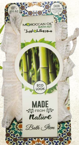
BACK STRAP Item No. ST0840-N NTC: 3777677