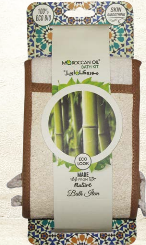
LOOFAH BACK STRAP BIG Item No. LT1162 NTC: 3777680