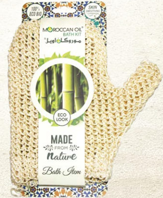
SISAL BATH MITT Item No. ST1721-1 NTC: 3777691