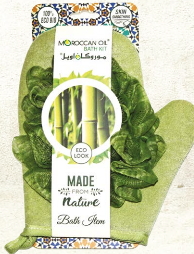
BATH GLOVE Item No. ST1721-N NTC: 3777678