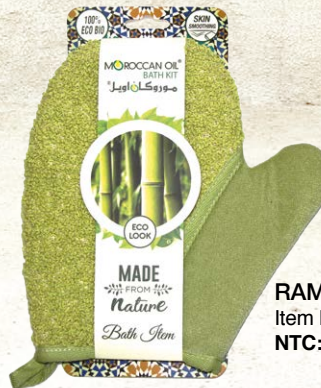
RAMIE BATH GLOVE Item No. ST2023-5 NTC: 377686