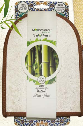
LOOFAH MITT Item No. LT1621 NTC: 377681