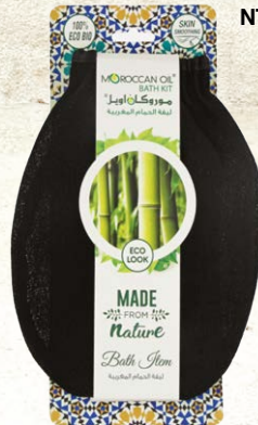
MOROCCAN OIL BATH GLOVE Item No. RH-010 NTC: 3777692